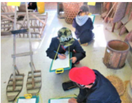
※昔の道具に興味津々の3年生

昔の道具について調べることを通して当時の人々のくらしや考え方に触れ、生活の変化や人々の苦労や工夫、願いに思いを馳せてもらいたいと思います。