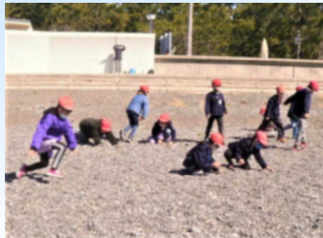
※がんばってカードを探すぞ！

縮小版となったお別れ遠足でしたが、子どもたちの心にしっかり残る楽しい思い出になったと思います。準備をがんばってくれた6年生のみなさん、ありがとう。