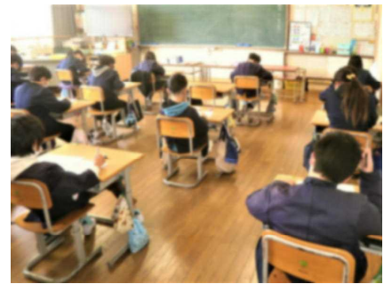
※評価テストを受ける5年生

このテストの結果を分析して学力向上の対策を立て、弱点を克服しながら5月に行われる予定の全国学力・学習状況調査に向けて準備をしていくことになります。