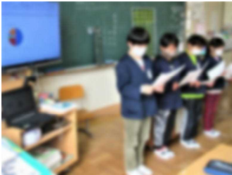
※電子黒板に自作のグラフを映して発表！

写真にあるように、子どもたちはタブレットでExcelを駆使し、結果をグラフに表したものを電子黒板に映して発表しました。ICT活用力がついてきたことをうれしく思います。しかし、何よりまとめたものをしっかり発表できたことを褒めたいと思います。高学年への準備ができてきましたね。今後は楽しみです。