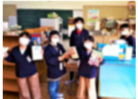
※昼休みの貸し出し風景(8日)

しっかり本を読んで、知識と情操を豊かにしてほしいと願っています。みんな、目標達成まであと少しだ！ しっかり本を読もう！