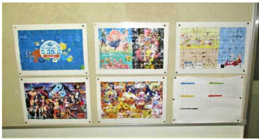
※廊下に掲示されている5枚のパズルと組み分け表